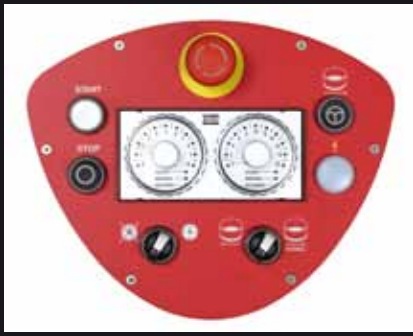
Pannello comandi Control panel