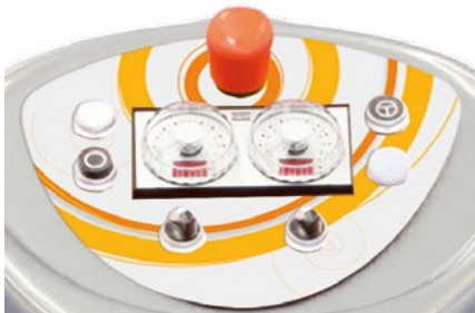
Pannello comandi standard / Standard control panel